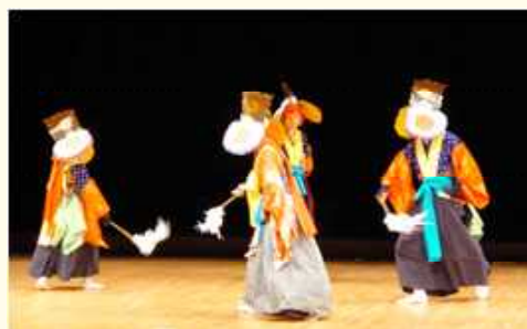
郷土文化伝承(増沢神楽)