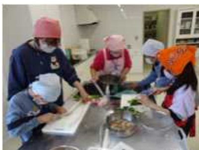
野菜を切る子ども達

また、炊き上がったごはんを焼きおにぎりも作り、みんなでおいしく食べ、「はっとうをうすく伸ばすのが大変だったけど、おいしくできて良かった」「さがきがうまくて良かった」「みんなで楽しくごはんを食べれて良かった」と喜んでいました。