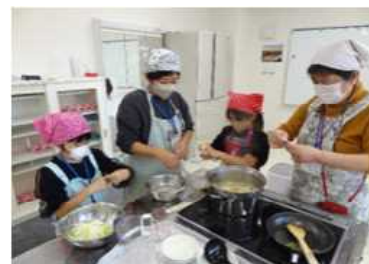
はっとうも上手に伸ばせました

青少年事業「親子、祖父母クッキング教室」を11月17日、町内の小学生親子ら13人が参加して藤沢市民センターで、開催しました。