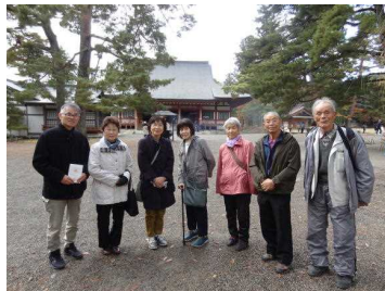
毛越寺で記念撮影