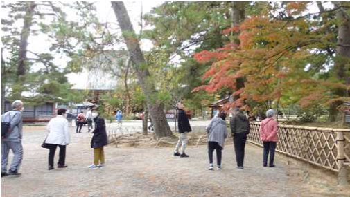
紅葉したもみじを見ながら散策

お昼に道の駅巖美溪の餅膳を堪能した後は、毛越寺の庭園を散策し、紅葉したもみじにカメラを向けていました。