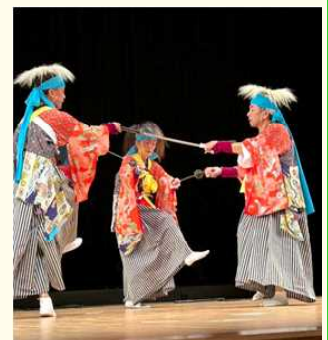
郷土文化伝承(本郷神楽)