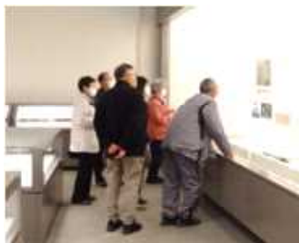
博物館の資料に引き込まれる